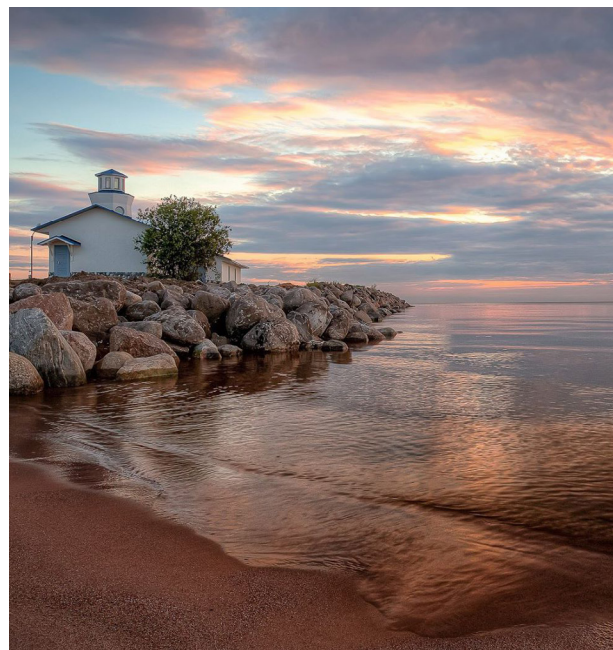
Ладожское озеро — озеро в Республике Карелия (северный и восточный берег) и Ленинградской области (западный, южный и юго-восточный берег), крупнейшее пресноводное озеро в Европе.